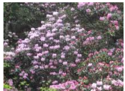
鎌掛谷ホンシャクナゲ群落