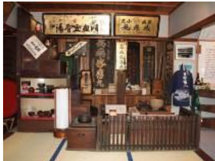
近江日野商人館の展示の様子