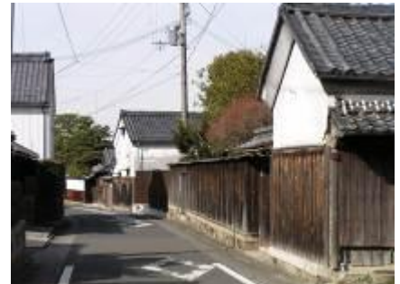
古い町並み（南大窪町）