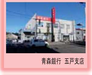
青森銀行 五戸支店