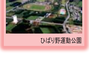
ひばり野運動公園