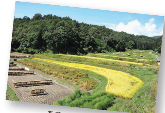
菱野・宇坪入の棚田 (日本棚田百選)