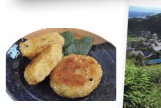
菱野・ヤカタの峯

浅間山麓と千曲川のおりなす 詩情豊かな山あいの村々。 この暮らしの風景を味わうための、 おすすめのめぐり路を楽しいカフェを開店！ 歩くこと話すことで、何かが変わる5日間。