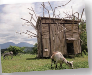
読書の森・どうらくオルガン