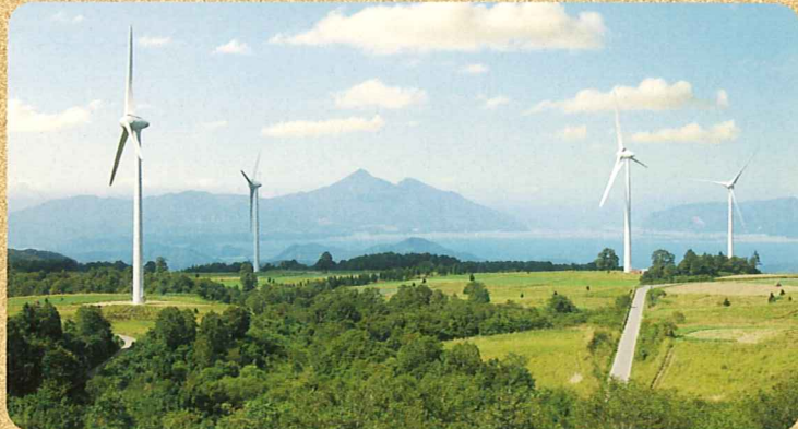
布引風の高原から見る「磐梯山と猪苗代湖」