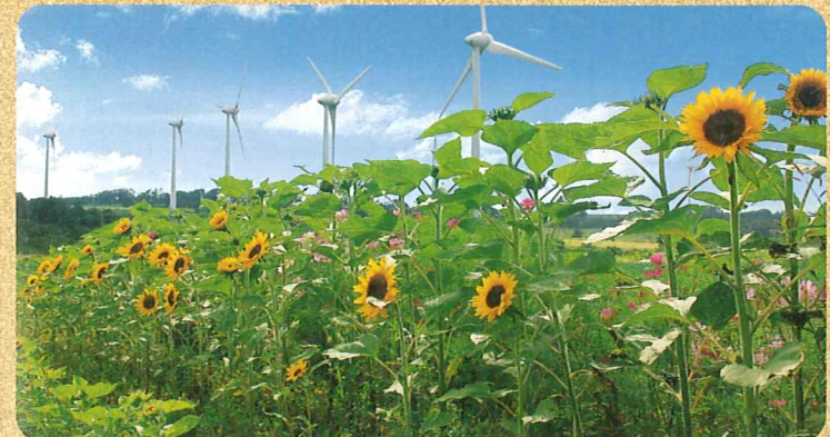
夏のひまわり畑と風車。