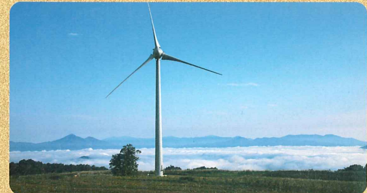
布引風の高原の眼下に「雲海」を見ることも。