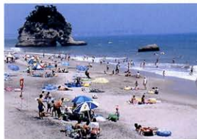
磯原二ツ島海水浴場

海から突き出た二ツ島の眺めが素晴らしい、澄んだマリブルーが自慢の磯原二ツ島海水浴場。県外からのお客様も多く、家族連れを中心に賑わいを見せます。●開設期間/7月中旬~8月中旬