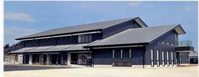
北茨城市漁業歴史資料館(よう・そろー)

北原白秋、西条八十とならぶ三大童謡詩人・野口雨情。磯原の海を望むように建つ雨情の生家は「観海亭」と呼ばれ、今でも多くの人が訪れます。●資料館入館料/大人・小人100円 ●問い合わせ先/0293-42-1891