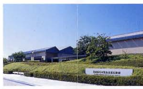
茨城県天心記念五浦美術館

絶景の名勝地で港の東に薬師堂、西には八幡神社があり、湾内は波静かで、まるで鏡のように奇岩や草木を映し出しています。アワビ、ウニが特産で、アンコウ、ヒラメ、タイなどの新鮮な魚が観光客の舌を楽させてくれます。