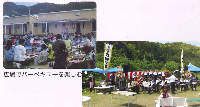
広場でバーベキューを楽しむ