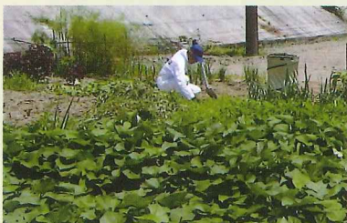
農作業にいそしむ利用者