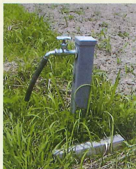
散水用の水利も完備