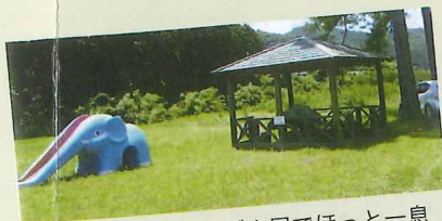
あずま屋でほっと一息