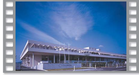
公立刈田総合病院

まちづくりの一環として、時代のひとつ先を行くデザイン建築物が点在するまち。イタリアデダロミノス国際建築賞やグッドデザイン賞受賞の建物をはじめ、特徴的な建物は独特なエッセンスを生み出す。