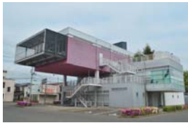
情報センター アテネ