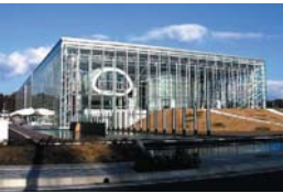
ホワイトキューブ