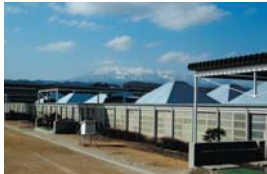
白石市第二小学校