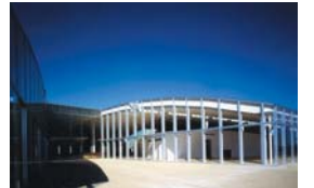
総合福祉センター