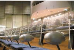
ホワイトキューブ ホール