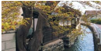
白石城下を囲む水路