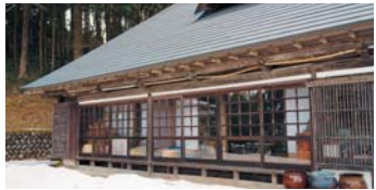
茅葺き屋根の古民家