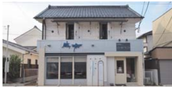
蔵が随所にある街