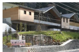
やどり温泉いやしの湯