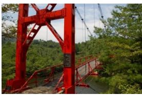
杉村公園(総合公園)