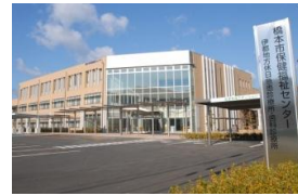
保健福祉センター