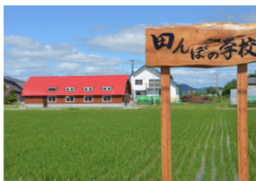
当麻町3条東2丁目 (当麻町公民館まともーる横)