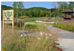
当麻町市街6区 ☎ 080-1979-8137