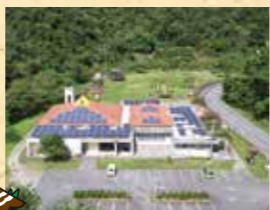
山と水の生活博物館