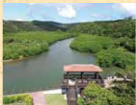
慶佐次湾のヒルギ林 (国立公園指定)