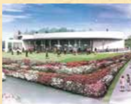
文化スポーツ記念館