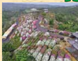
村民の森つつし園