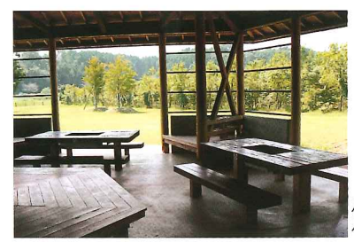
バーベキューハウス内観