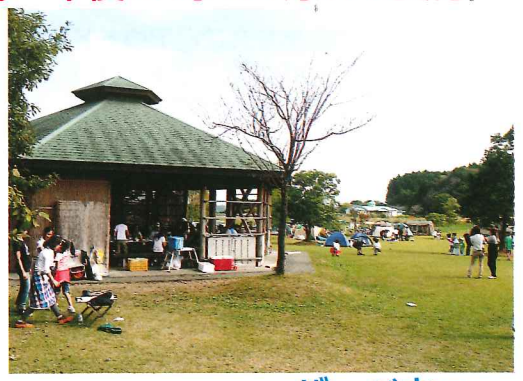
バーベキューハウス