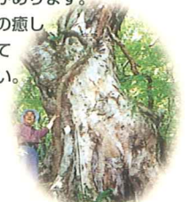
樹齢300年の大ケヤキ