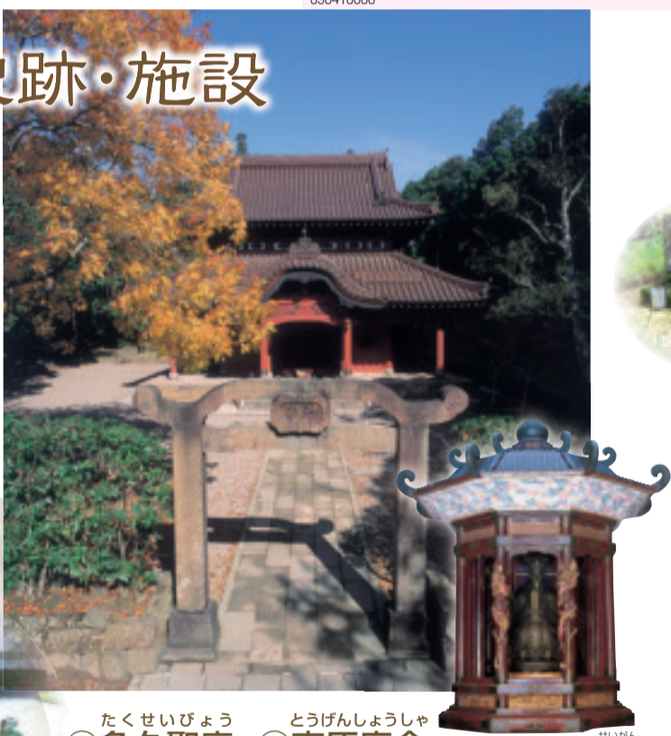
①多々聖廟と②東原彦舎

多々は歴史薫るまちで、数多くの施設があります。とりわけ、多々聖廟周辺には観るものが集まっています。ゆつらりと歩いてみませんか？