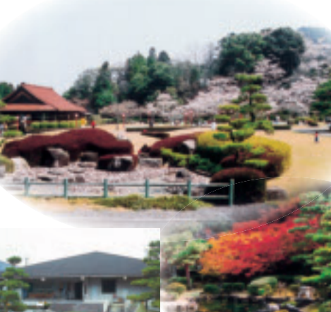
⑥西溪公園と⑧郷土資料館

県の重要文化財 市の天然記念物 1193年、多々宗直が建てた神社で、建築様式や彫刻などは桃山期の特徴があります。境内には三本杉の巨木があります。