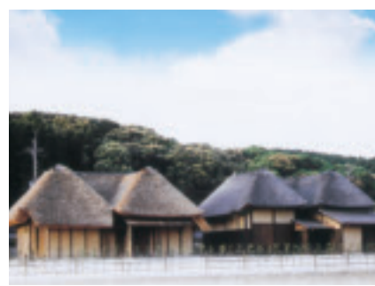
⑫くど造り民家「川打家」「森家」

国の重要有形民俗文化財 那部佐賀の酒造用具2334点が収蔵されており、酒造りの工程や用具などを学ぶことができます。