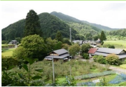
山あいに暮らしが息づく築川地域