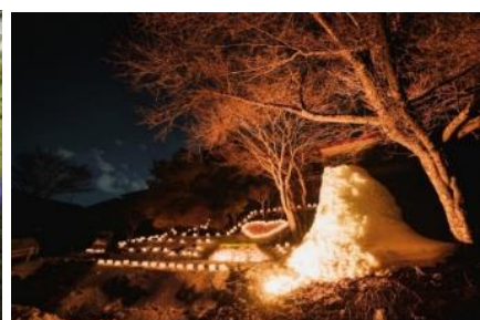
厳冬のイベント「山里の雪灯り」