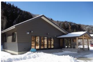
砂子沢生活改善センター(令和3年12月竣工)