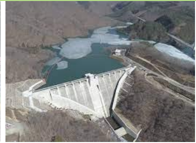
県営築川ダム(令和3年7月完工)