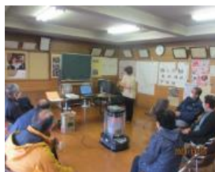
隊員による座談会での話し合い