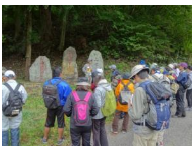
旧宮古街道を歩くツアー

本テーマを担当する隊員には、築川地域の豊かな自然と人々の暮らしに根付く様々な魅力を感じてもらいながら、そこで暮らす皆さんとともに地域資源を活用し、磨く活動に取り組んでいただきます。