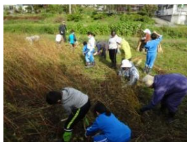
そば撒き・収穫体験(子供会の恒例行事)