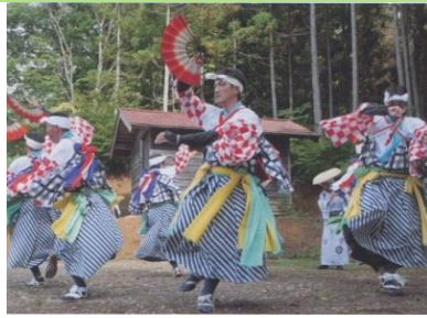
古式豊かな儀礼を今に残す築川高館剣舞