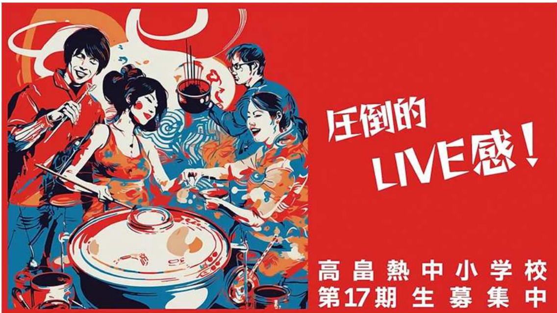
AI を用いた募集広告製作