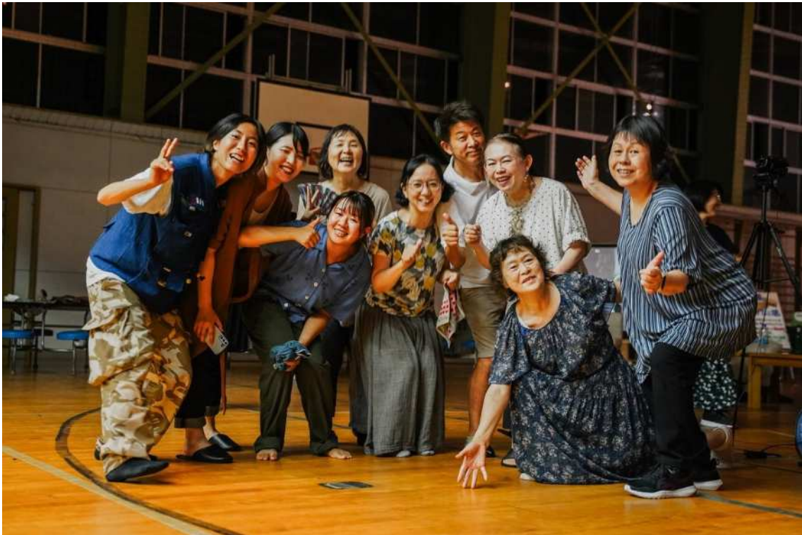
世代を超えてナイトパーティイベント