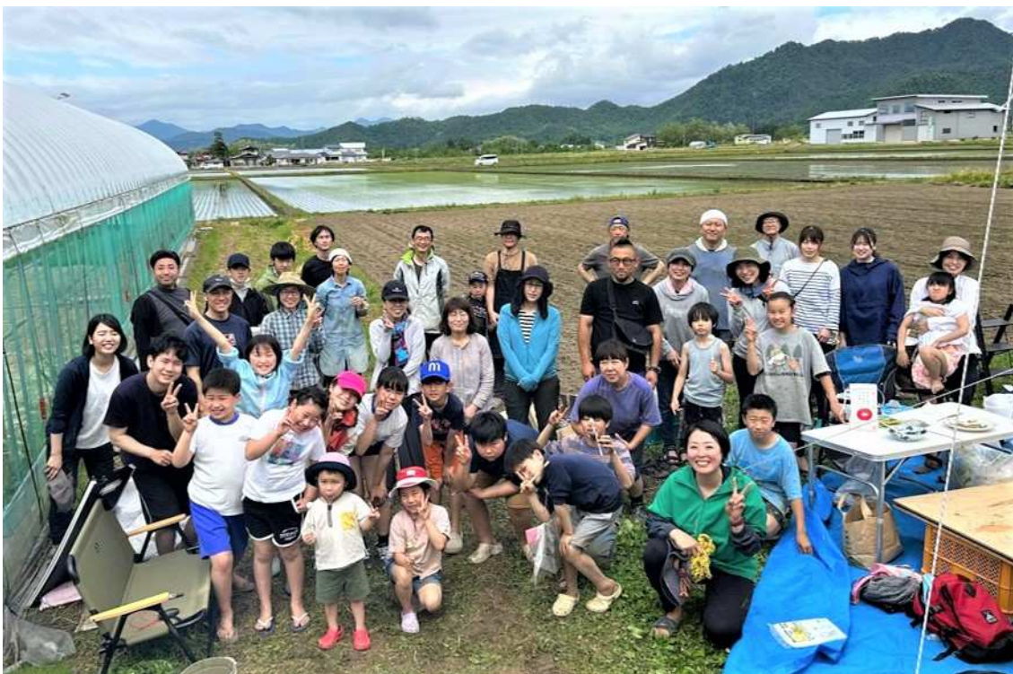
地域の各種団体を巻き込んで田植えイベント

経験やスキルは必要ありませんが、新しい事にチャレンジしていく好奇心やみんなを巻き込んだ取り組みを作る企画力のある方歓迎です。地域内外の方と関わる中で“あなた色の独自の取り組み”を作ってください、今後にも繋がる足がかりとなれば幸いです。