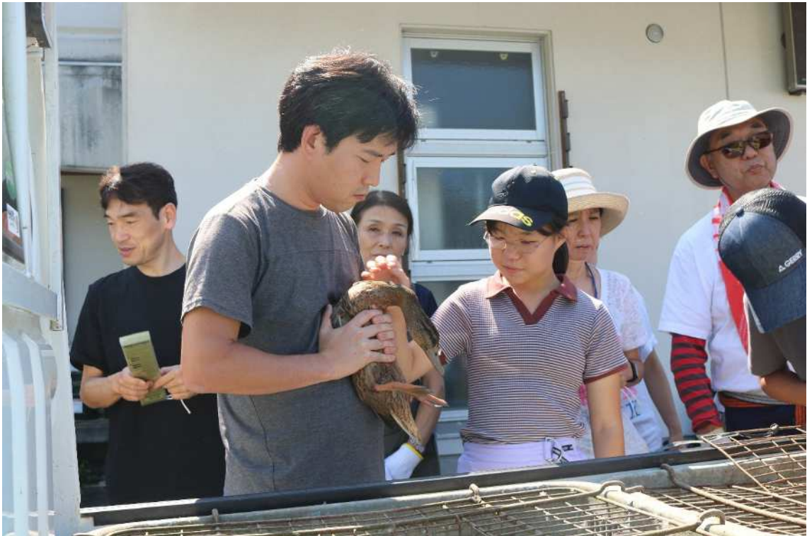
「命」をいただく課外プログラム