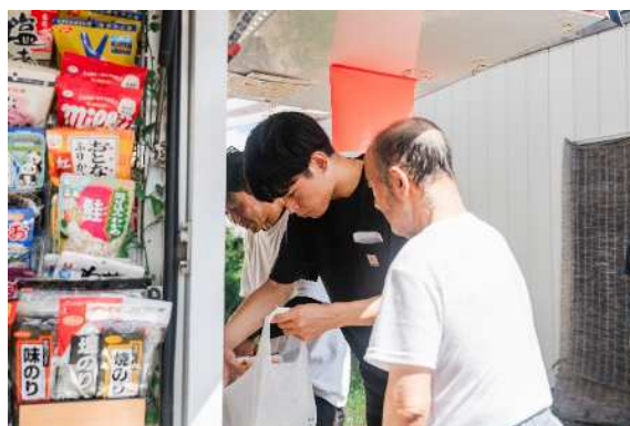
高畠地域留学の様子