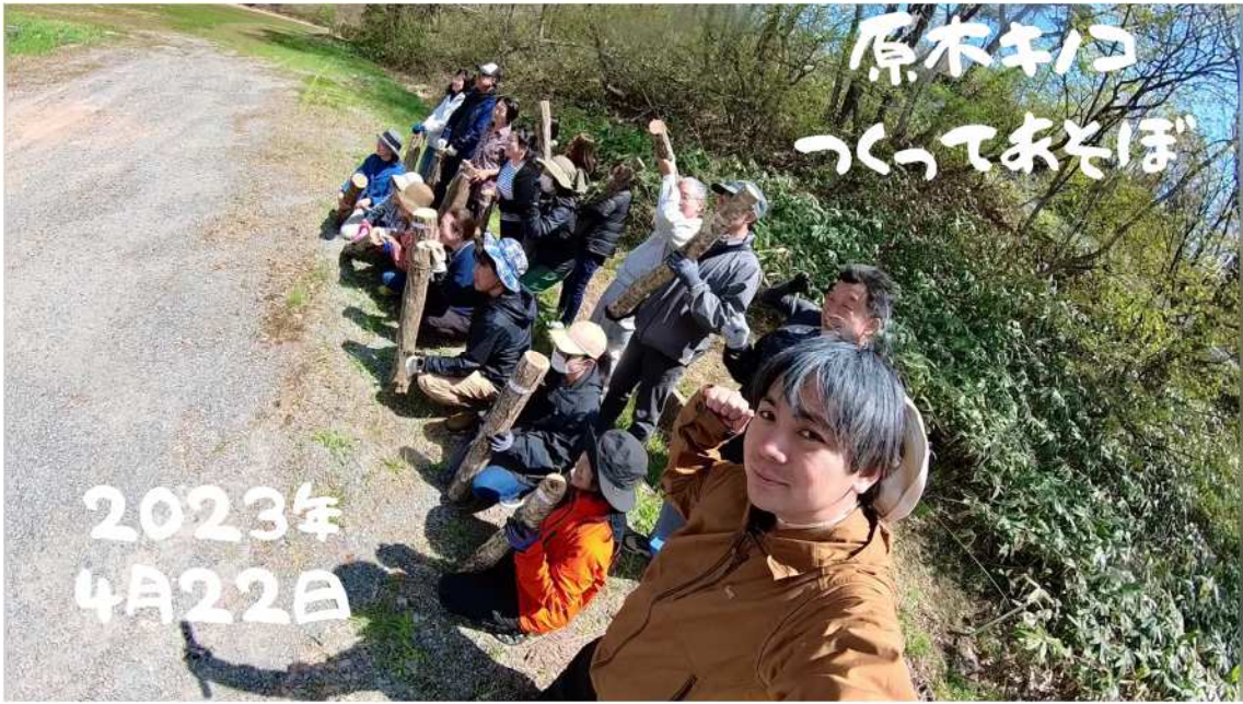
Vlog での取り組み発信