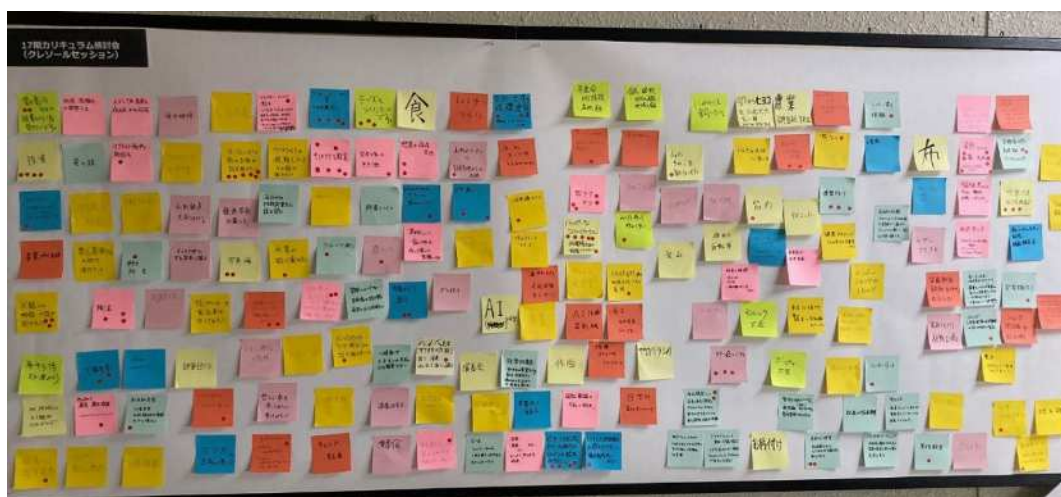
生徒から出た授業アイデア

熱中小学校は学び続ける学校として生徒のみなさんと一緒になってカリキュラムやイベントを企画しています。その時々集まる人の興味に合わせた授業企画などに関わっていただきながら、様々な分野で活躍される先生のお話を間近で聞くことができます。