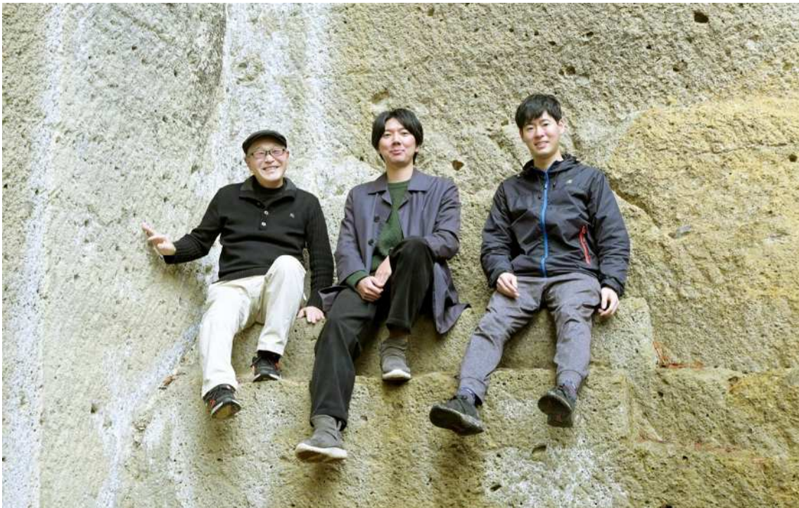
高畠町地域おこし協力隊（2023年3月撮影）

高畠町ではこれまで13名の方を地域おこし協力隊として委嘱し、現在は4名の方が活動しています。そのうち2名は旧時沢小学校（高畠熱中小学校事務局）に席を置き、熱中小学校プロジェクトの運営について、NPO法人はじまりの学校と共同で行っております。