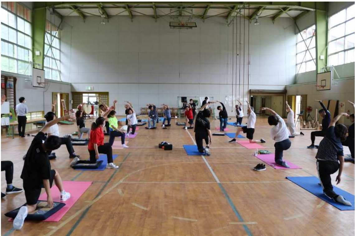
体育館でのコンディショニング体験