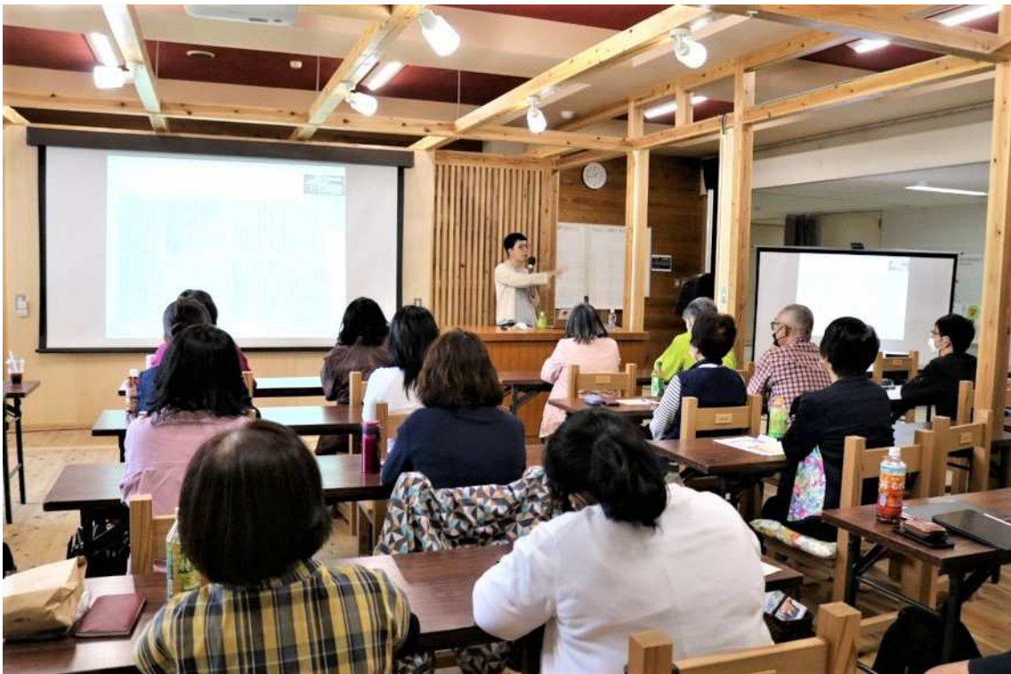
教室での授業風景

熱中小学校は「もういちど 7 歳の目で世界を…」をキャッチコピーに活動する、生涯学習の拠点です。様々な分野で活躍される講師の方からのお話や体験から、ワクワクするような未知の出会いの創出、新しい一歩を踏み出す人を応援する活動を行っています。