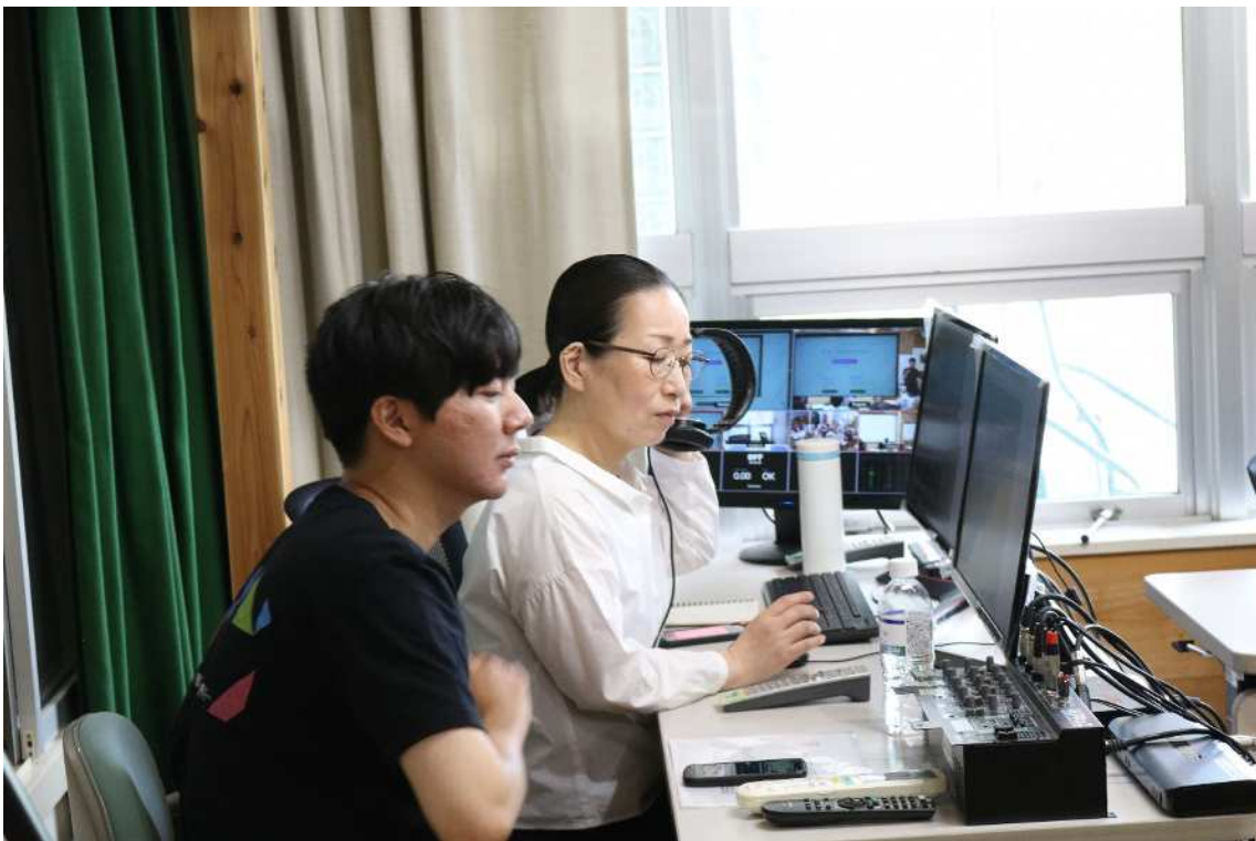
授業の動画配信の様子

高畠熱中小学校は廃校再生や地方創生のプロジェクトとしても全国に先駆けた取り組みを行っています。動画配信やSNSやAIを活用した広報活動などにも関わっていただく他、現場のリアルや運営全般について活動を通じて学べると共に、今後も新しいアイデアを実装しながら取り組みを作っていく事ができます。